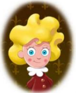
Rey Baby I

Descubrir... ¡UN LUGAR ÚNICO EN EL MUNDO!