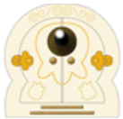
PUERTA RATÓN PÉREZ